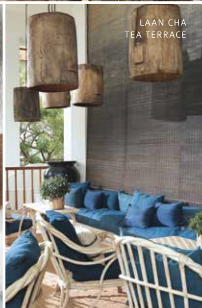
LAAN CHA TEA TERRACE