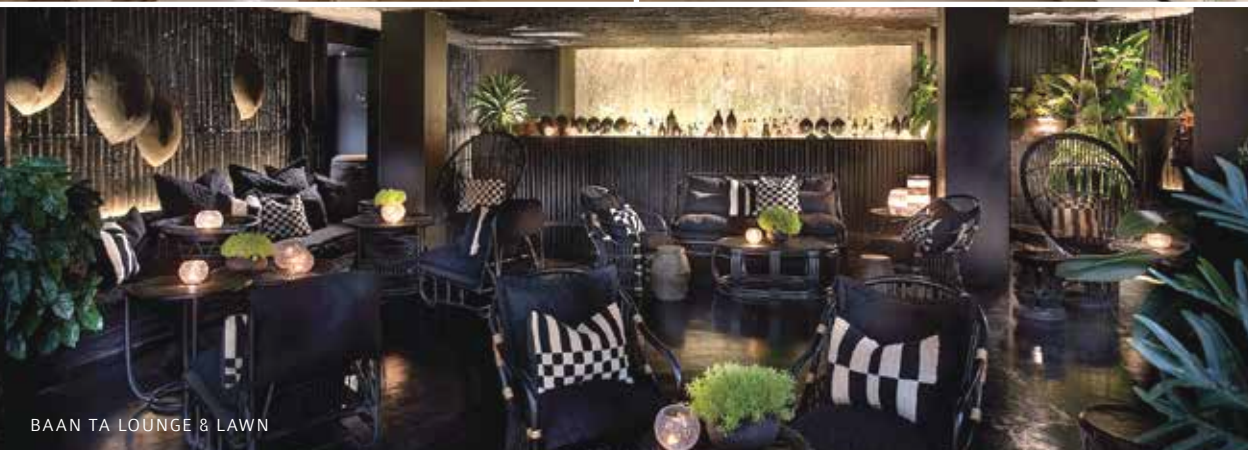
BAAAN TA LOUNGE & LAWN