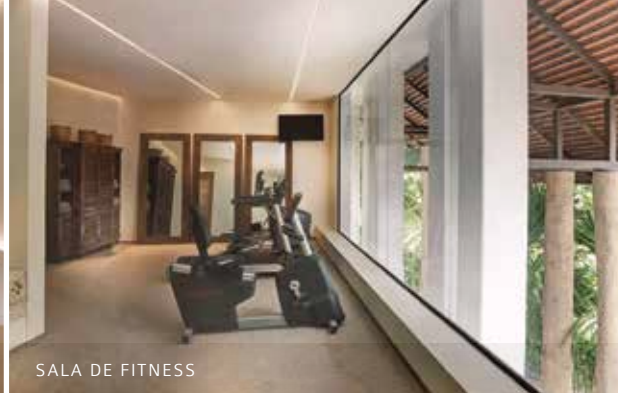
SALA DE FITNESS