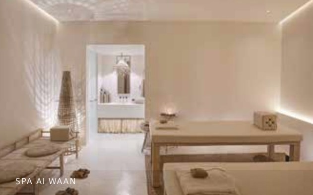
SPA AI WAAN